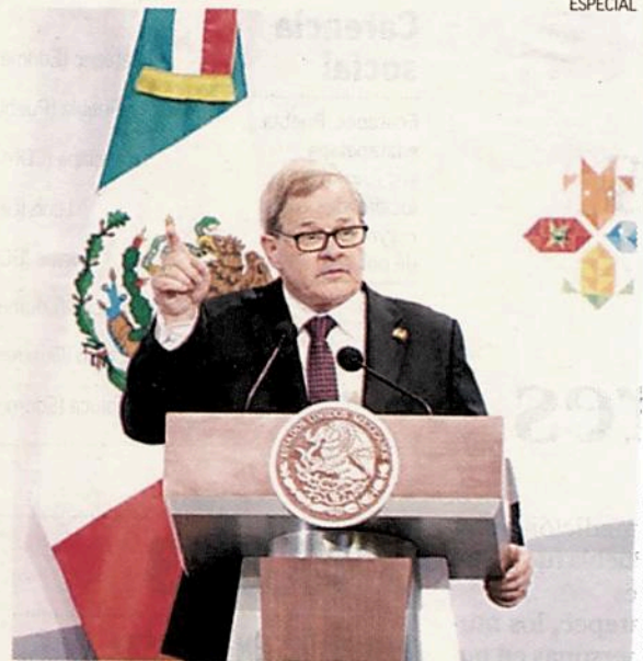
MACAULAY. El ministro de agricultura dijo que ambas naciones forman un integrado y fuerte sector alimenticio.

EL SECTOR agrícola y la comunidad de negocios ha pedido no lastimar el acuerdo, sino que continúe el gran valor derivado del TLCAN.