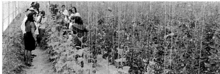
Tras evaluación anual cumplen programas municipales; destaca alternativa orgánica alimentaria.

Además, fueron otorgados diversos apoyos para el sector, entre ellos, más de mil herramientas de labranza a los productores que participaron en el tradicional Paseo de la Agricultura; igualmente se favoreció la exposición permanente de productores en diversos foros, como en la Feria de San Isidro, entre otros.