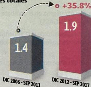
Billones de dólares acumulados en exportaciones totales