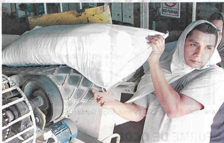
Ingenios buscan extender su horizonte más allá de EU

Por lo tanto, consideró viable incluir en la negociación para la modernización del Tratado de Libre Comercio Unión Europea México (TL-CUEM), un capítulo sobre el azúcar