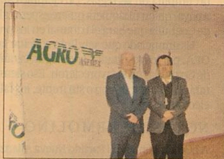
Las pérdidas por desastres naturales son absorbidas por las firmas de seguros, no por los productores, dijo el director general de Agroasemex.

En la conferencia ofrecida por el director general de la paraestatal, se destacaron los eventos catastróficos que han ocurrido a nivel mundial. Resaltó que en los últimos dos años se han intensificado las afectaciones por fenómenos naturales en el planeta, con cerca de 1,900 eventos, de los cuales 750 son relevantes: terremotos, tsunami, huracanes, ciclones, inundaciones y sequías.