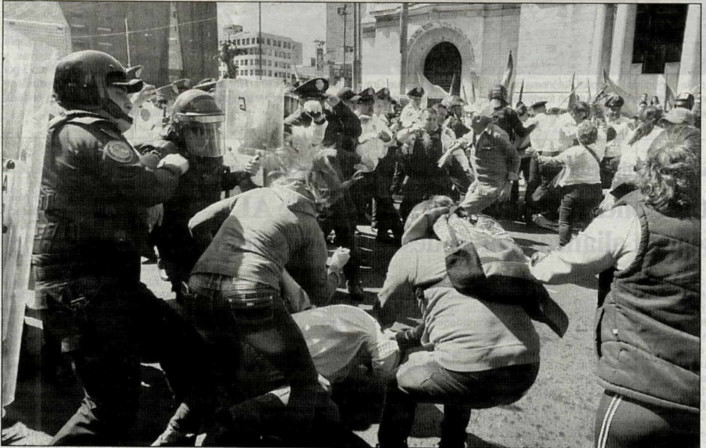
Campesinos de la Unión Nacional de Trabajadores Agrícolas se enfrentaron con granaderos cuando realizaban un bloqueo en Eje Central Lázaro Cárdenas y Madero