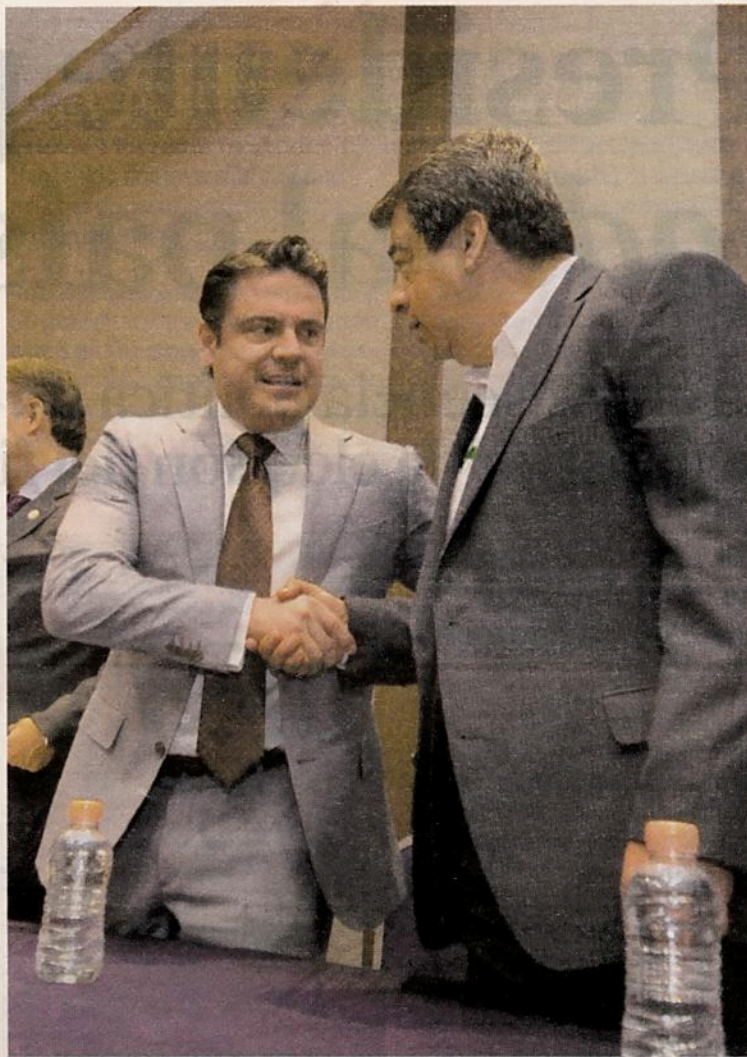
EVENTO. El gobernador de Jalisco, Aristóteles Sandoval, inauguró, junto con otras personalidades, el Simposio de Recursos Genéticos.

Por su parte, el rector de la Universidad de Guadalajara, Tonnatiuh Bravo Padilla, recordó que Jalisco posee 29% de la flora y 34% de la fauna nacional, además de 88 kilómetros de litoral y 19 áreas naturales protegidas.