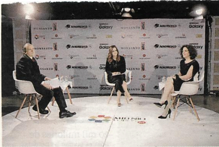
Participantes en la charla.