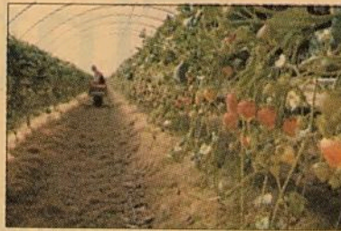
Las fresas son uno de los frutos que podrían tener restricciones.

Los cambios sugeridos por Estados Unidos permitirían que para un grupo determinado de productos se podría demostrar daño en un periodo más corto de tiempo en las investigaciones sobre prácticas desleales