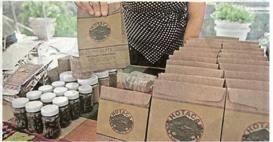
Productos con cacao de Chiapas están presentes en todas las ferias del país

"No contamos con ningún recurso, estuvimos en la comisión de agricultura que