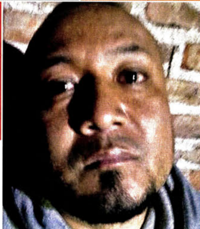
El Marro fue detenido ayer junto con su lugarteniente.