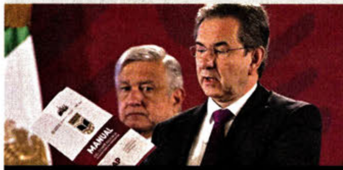
Esteban Moctezuma, titular de la SEP (mayo 2020)

Ayuda para desterrar la corrupción en lo que se destina al mejoramiento para escuelas.