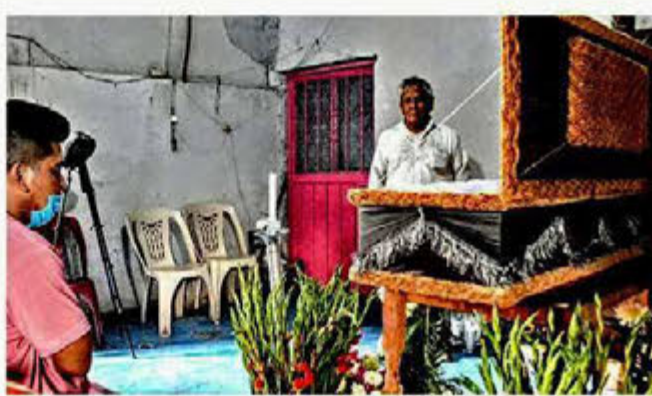
Al menos 9 personas en Telixtac, Morelos, murieron por consumir alcohol adulterado, una de ellas fue velada ayer.

La escasez de cerveza, debido a que la industria paró la producción al ser declarada no esencial, también favoreció el consumo de vinos y licores, que sin embargo están restringidos por algunas autoridades locales.