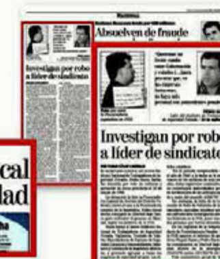
Investigan por robo a líder de sindicato