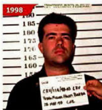
En marzo de 1998 fue detenido por robo de vehículo y portación de arma prohibida.

Haces, según las denuncias, obligaba a empresas a afiliarse a trabajadores a su gremio y solicitaba el 4 por ciento del total de la nómina.