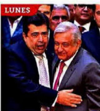
El líder de la CATEM mostró el lunes a AMLO el "músculo" de esa central.