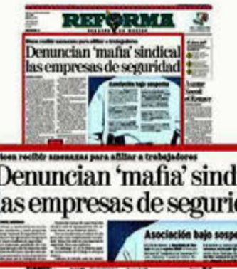
Denuncian 'mafia' sindical las empresas de seguridad