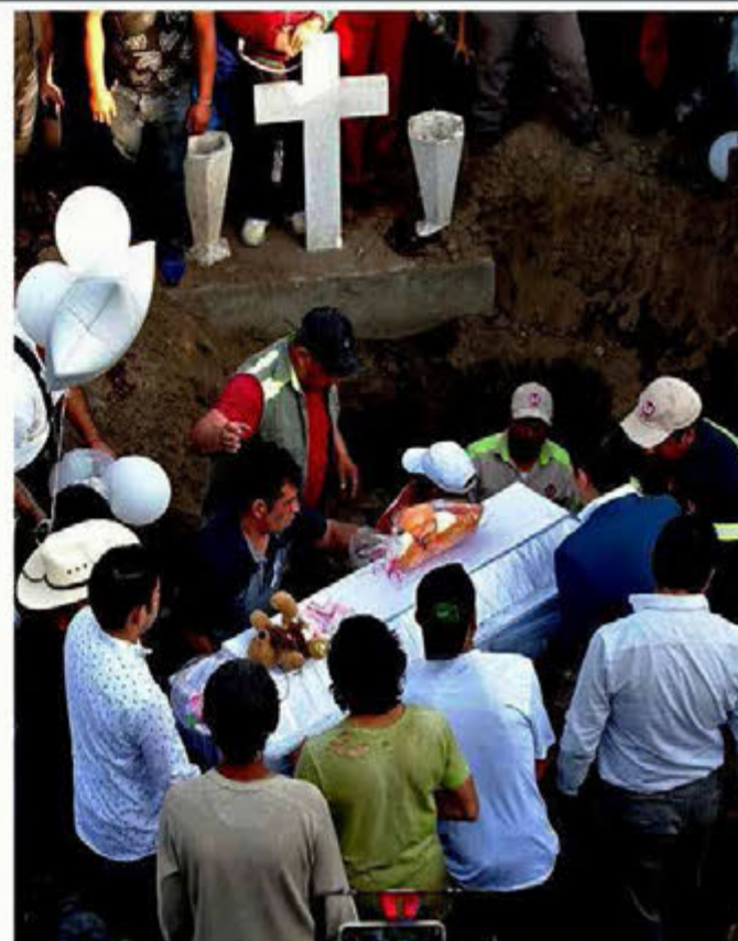
Antes de sepultarlo, el cuerpo de la niña fue llevado a su escuela. Más de 200 personas acompañaron el cortejo.

Autor de desnudos que lleva al bronce o al mármol, con reminiscencias a la Grecia clásica, el británico Stuart Sandford prepara un proyecto para México. CULTURA (PÁG. 17)