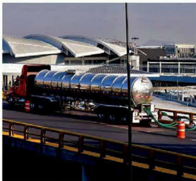
El servicio de agua al AICM, surtido de manera irregular por la empresa Servicio Trejo Pipas de Agua, mantuvo ayer su operación sin ningún problema. A diario surte en promedio 38 cargas a la terminal aérea.