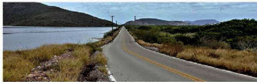
Los ejidatarios que se ubican a lo largo de la ruta Topolobampo-El Maviri piden 4 mdp para permitir la colocación de fibra óptica.

Aseguradora Afirme, quien aseguró el servicio durante 2019 tras ganarlo en una subasta, propuso al Metro renovar el mismo seguro con un costo de 303 millones.