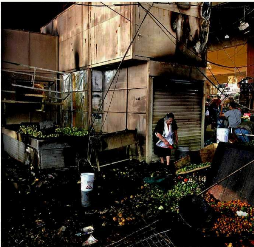
La conflagración en la Nave Mayor de La Merced inició en el área de flores. El siniestro dejó dos personas muertas.