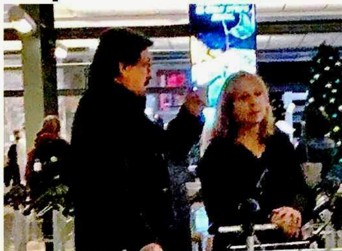
Gómez Urrutia y su esposa llegaron a Vancouver el jueves.

No existe evidencia de que haya realizado el procedimiento que Canadá exige para certificar que se ha dejado de ser nacional de ese país.