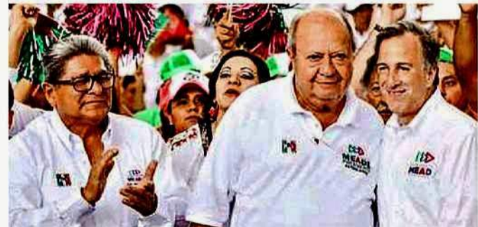
Limón Hernández (izq.), nuevo líder petrolero, apoyó, junto a Romero Deschamps, a Meade en la campaña de 2018.