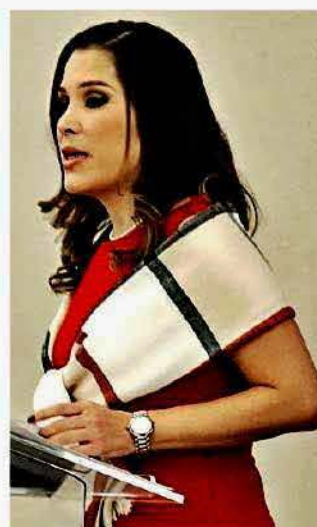
Puente es candidata del PRI a la Cámara de Diputados.