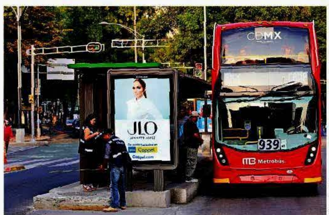
La publicidad fue colocada a lo largo de toda la Ruta, incluido Santa Fe, a donde todavía no llega el MB.

En gasolineras y talleres de costura, la CDMX aplica verificaciones para detectar anomalías laborales. CIUDAD 4