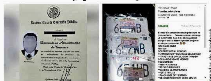
En la plataforma Marketplace de Facebook se venden desde documentos falsificados y placas hasta cartuchos.

Facebook advierte que los clasificados deben cumplir con sus normas o, de lo