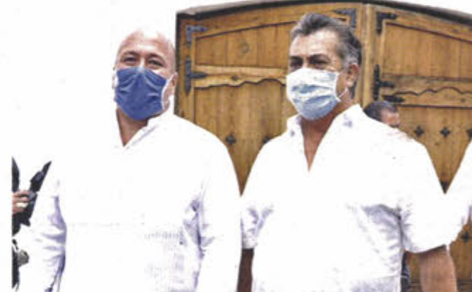
La Reunión Interestatal Covid-19 se llevó a cabo en Parras.

También ponen lupa al Pacto Fiscal y piden reembolso de gastos por Covid