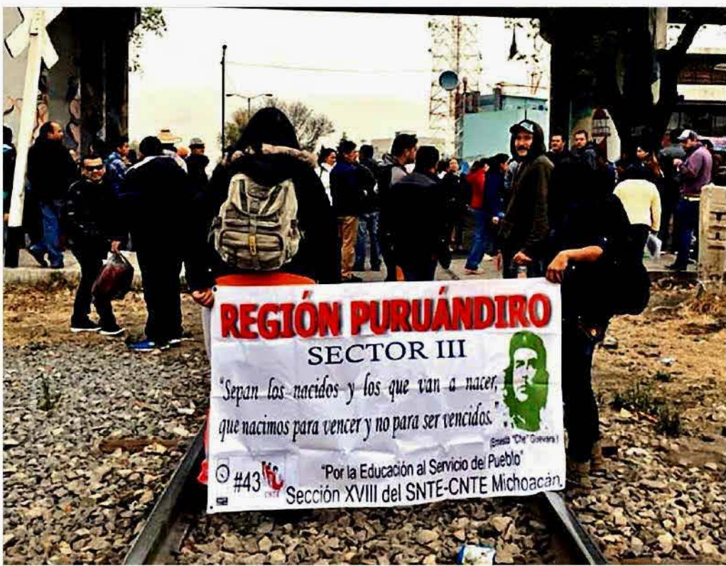
El bloqueo a las vías del tren en Michoacán ha causado pérdidas a la industria siderúrgica por 400 millones de pesos.