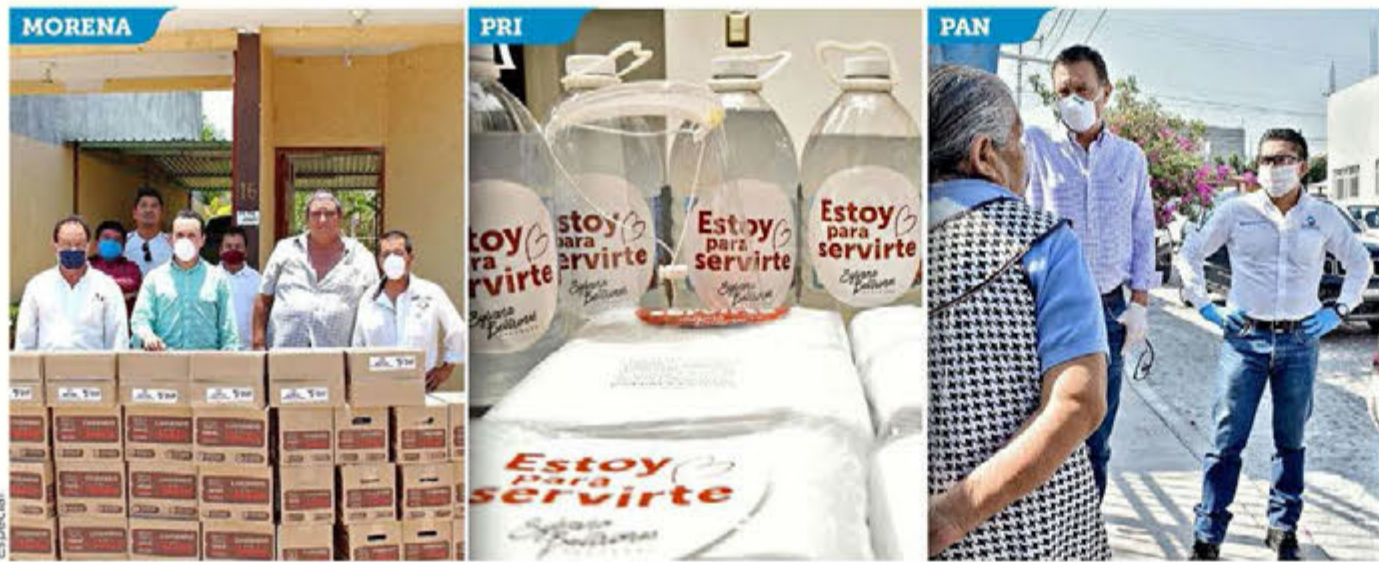
EN REDES. En el Edomex, un operador morenista presumió la entrega de apoyos a nombre de Horacio Duarte, mientras en Sonora, la senadora Sylvana Beltrones, y en Querétaro, Mauricio Kuri, hicieron lo propio.

El documento ya fue entregado a los Gobiernos del Estado de México e Hidalgo, así como a los municipios involucrados de esos dos estados. Además, se prevé la construcción de dos CETRAMs.