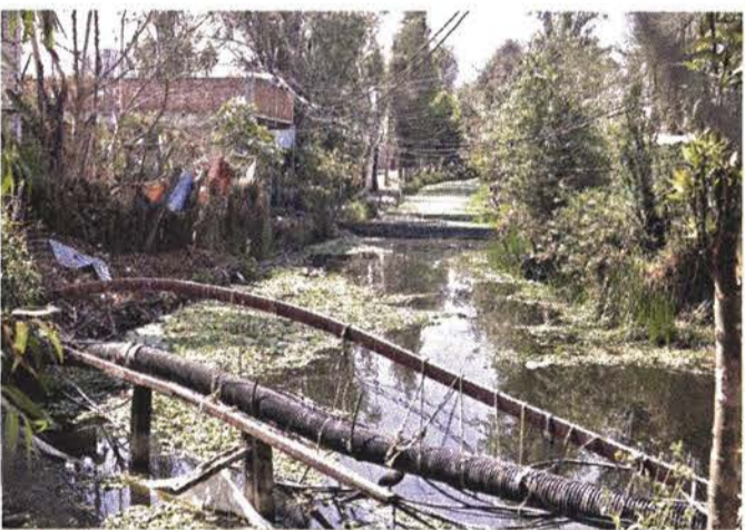
■ Drenaje y electrificación avanzan sobre los canales.