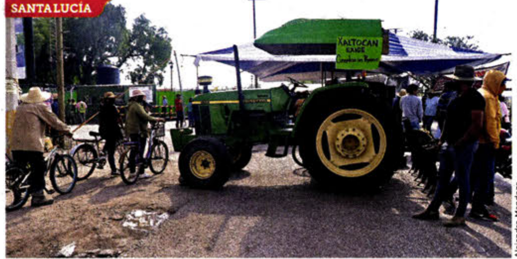
Los habitantes de San Miguel Xaltocan, tienen bloqueados los accesos a la base de Santa Lucia desde el lunes.