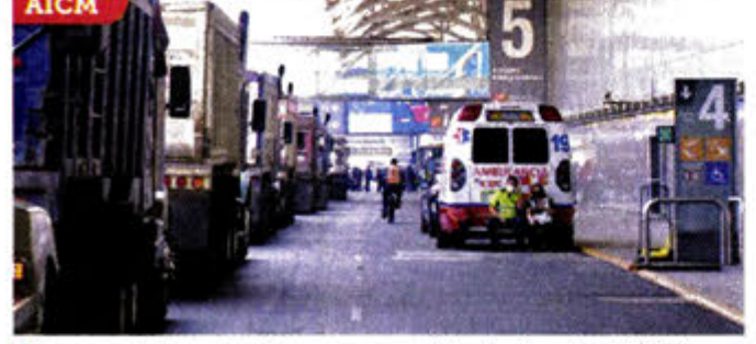
Transportistas estacionaron sus unidades frente al AICM.

Son residentes del Municipio de Nextlalpan, en el EDOMEX, quienes exigen el pago de 127 hectáreas que fueron consideradas en el proyecto aeroportuario, así como la construcción de obras comunitarias, dotación de servicios públicos y la conexión a un pozo de agua, como parte de las acciones de mitigación de la megaobra. Desde el lunes, los manifestantes bloquean un cruce ferroviario de la ruta México-Pachuca, y la carretera Teoloyucan-Xaltocan, y con ello impiden el ingreso de materiales a la zona de obras del