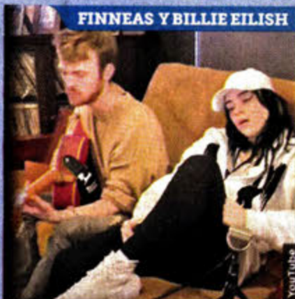
FINNEAS Y BILLIE EILISH

Sin escenario, pero conectadas a través de internet, estrellas musicales emocionaron a millones de seguidores durante el iHeart Living Room Concert para América. GENTE