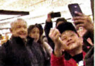
AMLO la noche del sábado al volar de Tijuana a Culiacán.

“Hoy ese incidente, ese montaje, porque inclusive llegué aquí en la noche a Culiacán y a la salida del avión me vuelven a tomar la temperatura y lo hago, porque todos debemos hacerlo, y afortunadamente 36 grados, o sea que estoy bien. Pero hoy veo las redes sociales y dicen que me negué a que me tomaran la temperatura, están muy molestos porque no aceptan la transformación”, consideró.