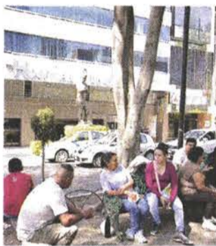
Personas esperan a familiares afuera del Hospital Obregón.