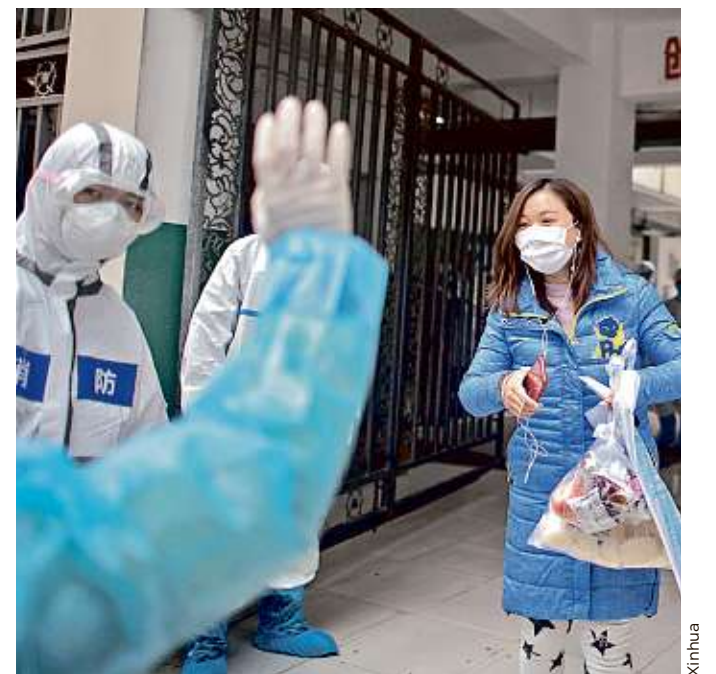
En Wuhan, China, la última paciente diagnosticada con Covid-19 abandona el hospital en el que estaba internada.