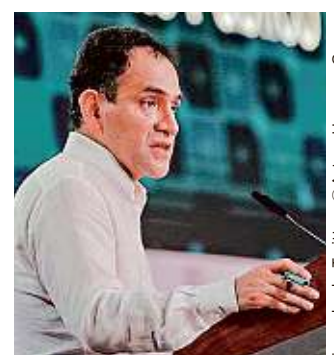
Herrera dijo que Salud marcará el tono frente al Covid-19.

El Subsecretario de Prevención y Promoción de la Salud, Hugo López-Gatell, solicitó oficialmente anoche a entidades públicas y privadas suspender servicios no