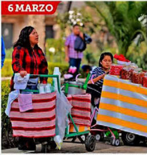
Una vendedora de nieves atendió la convocatoria a #UnDiaSinNosotras por lo que su papá se hizo cargo del negocio que tienen en Reforma a la altura de la Torre Mayor.