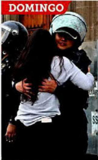
De mujer a mujer.

“Le respondí que estábamos para servirle. Agarré fuerzas, y el abrazo me dio aliento y motivación a ser mejor”, cuenta.