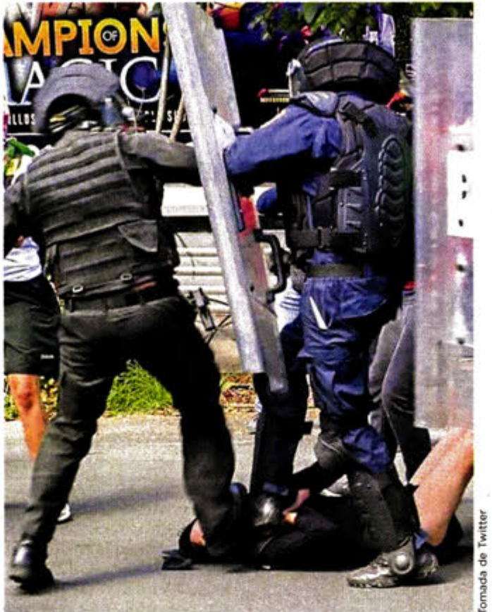
Los policías patearon a una joven manifestante de 16 años.

estadounidenses, los inconformes se dirigieron a la representación del Gobierno de Jalisco, que se encuentra en Campos Eliseos y Spencer. El objetivo era protestar por Giovanni López, quien a principios de mayo fue detenido por policías municipales de Jalisco, por presuntamente no portar cubrebocas, y que tras ser golpeado murió. Los jóvenes embozados lanzaron piedras, que reco-