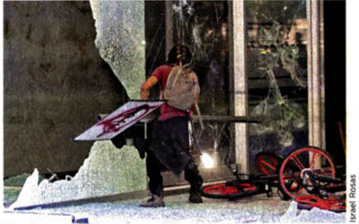
Los inconformes atacaron negocios e inmuebles a su paso.

gían de las jardineras de los edificios de Campos Eliseos, a la sede del Gobierno de Jalisco en la capital del País, así como bombas molotov y troncos de los árboles del Parque Gandhi, que está a unos metros de la representación. Luego de una hora, unos 500 policías lograron reple-