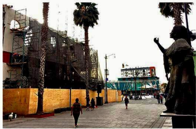
El inmueble, que albergará al Centro Cultural y Artesanal Indígena, está ubicado en la Plaza Garibaldi.