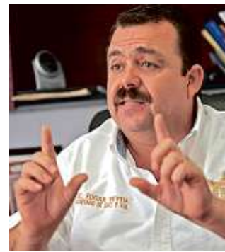
Édgar Veytia Cambero

Según la acusación, Veytia realizó actividades de narcotráfico prácticamente desde que el Congreso de Nayarit lo confirmó como Fiscal, en febrero de 2013, para un periodo de siete años luego de que estuvo encargado del despacho de la dependencia durante año y medio.