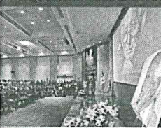
Al homenaje póstumo que el partido le hizo a Luis H. Álvarez, su líder moral, asistieron destacados panistas, como el ex Presidente Felipe Calderón y los ex líderes Luis Felipe Bravo Mena y Gustavo Madero. PÁG. 10