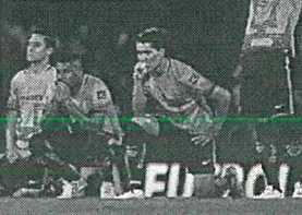
El equipo ecuatoriano Independiente del Valle en penales y quedó eliminada de la Libertadores.

Tras empatar en el global 3-3, la UNAM cayó 5-3 ante el equipo ecuatoriano Independiente del Valle en penales y quedó eliminada de la Libertadores.