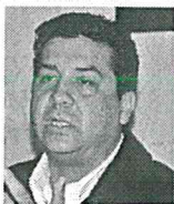
El panista adquirió el departamento en 2013 y aún litiga su derecho como socio del club.