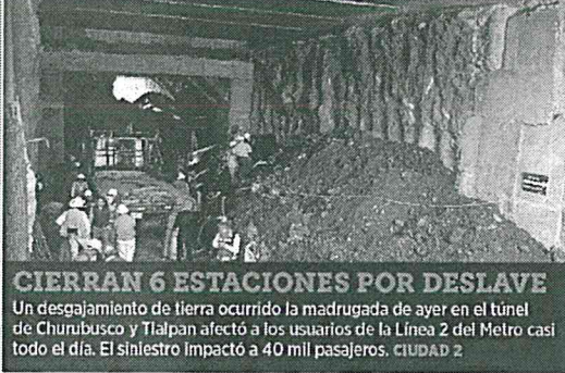
CIERRAN 6 ESTACIONES POR DESLAVE Un desmoronamiento de tierra ocurrido la madrugada de ayer en el túnel de Churubusco y Tlalpan afectó a los usuarios de la Línea 2 del Metro casi todo el día. El siniestro impactó a 40 mil pasajeros. CIUDAD 2

Pobladores de Santiago Ahitongo mataron a una mujer y un hombre. Los acusaban de plagiar a un joven. Hubo 18 detenidos. CIUDAD 6