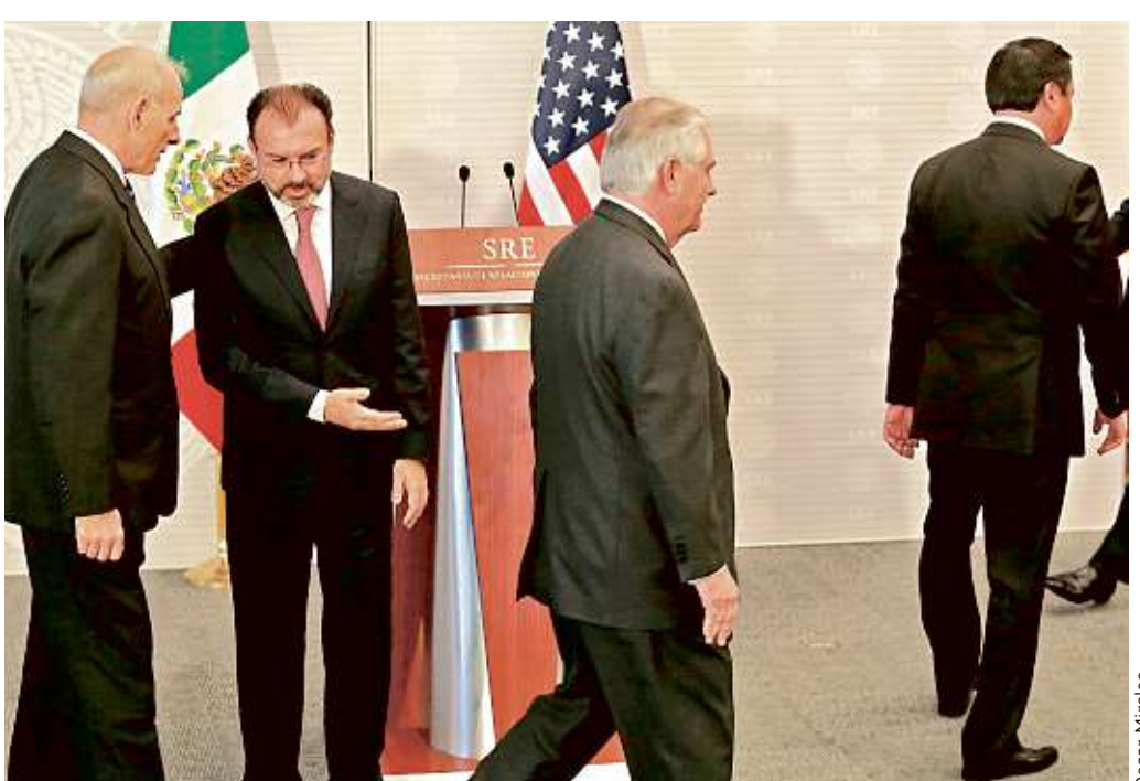
El encuentro entre los funcionarios mexicanos y estadounidenses se celebró en la Cancillería. Posteriormente, Rex Tillerson y John Kelly visitaron al Presidente Enrique Peña.

En Tijuana y Ciudad Juárez, la violencia arrecia por los enfrentamientos entre organizaciones de la delincuencia organizada. Por ejemplo, en Chihuahua, las denuncias por homicidio doloso subieron 57 por ciento en enero con respecto al mismo mes de 2016.