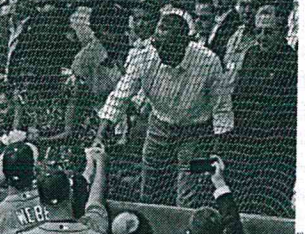
GANIA EU. En La Habana, Obama y Castro presenciaron el juego de béisbol en que Tampa Bay derrotó 4-1 a Cuba.

Atentados terroristas en Bélgica dejan 34 muertos y 230 heridos