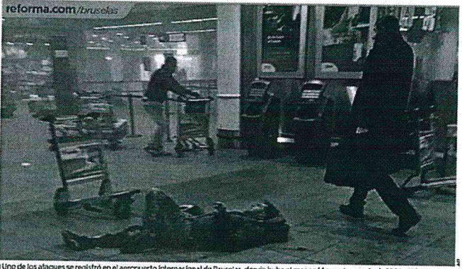
Un uno de los ataques se registró en el aeropuerto internacional de Bruselas, donde hubo al menos 14 muertos y más de 100 heridos.