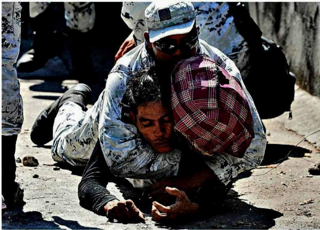
Soldados de la Guardia Nacional taclearon a migrantes para evitar que se internaran en el País.

Descarta Gobierno Asociación Público-Privada