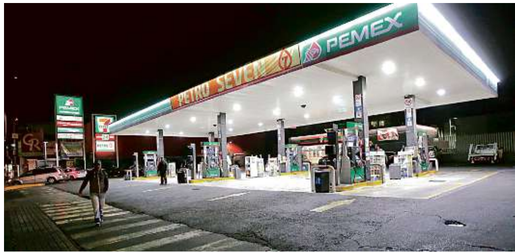
La estación de la Colonia Nonoalco, en la Delegación Benito Juárez, estuvo ayer sin gasolina.