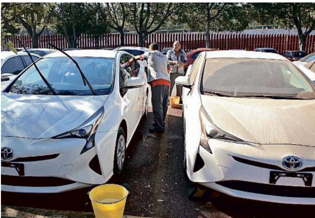
Después de haber estado arrumbados, ayer fueron lavados los autos híbridos en San Lázaro.

N/D: No disponible