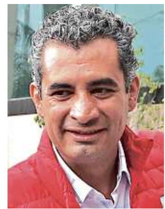
Ochoa acusó a Yunes de venganza política.

"Si eso provoca que los intereses que estoy afectando se muevan y quieran descalificarme, adelante, lo asumo", señaló el Gobernador.