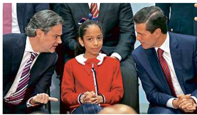
Nuño y Peña presentaron ayer el nuevo modelo educativo.

SÓLO PARA SUSCRIPTORES (Bajo petición previa)