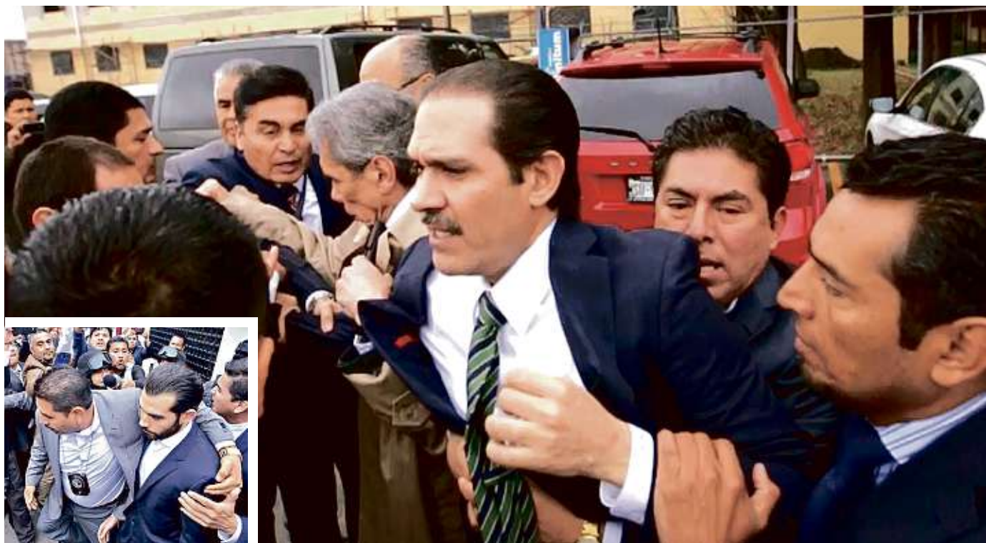
Entre jaloneos, el ex Gobernador fue llevado a los juzgados. Su hijo (recuadro) fue trasladado a un penal del Edomex.