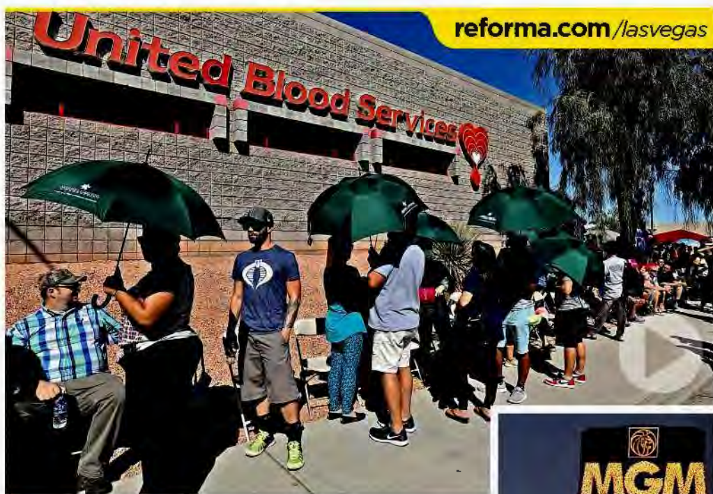
Decenas de personas hicieron fila ayer para donar sangre para los más de 500 heridos por el ataque.

El consorcio Braskem-IDEESA se ha desvinculado del pago de sobornos realizados por la empresa Odebrecht y ha defendido la legalidad de su contrato y operación en México.