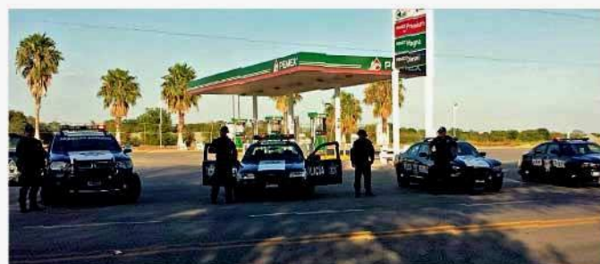
La mayoría de los negocios en la zona citrícola se mantuvo cerrada ayer pese a los patrullajes de PF y Fuerza Tamaulipas.

"En la zona, en al menos un año, no puedes hacer lo que estabas haciendo", dijo.