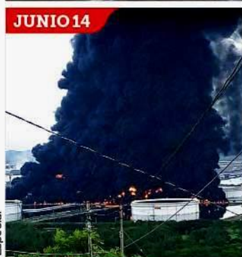
DE MAL EN PEOR. Primero, las lluvias inundaron la planta, luego, se incendió, y ahora está totalmente fuera de operación.

Estima Pemex que en dos semanas podrá decir cuándo reinicia Salina Cruz