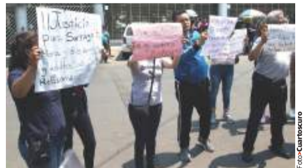
PROTESTA afuera del Tribunal Superior de Justicia, ayer.

» El próximo jueves se decide si la vinculan a proceso por homicidio culposo; familiares de menores fallecidos protestan afuera de la audiencia pág. 13