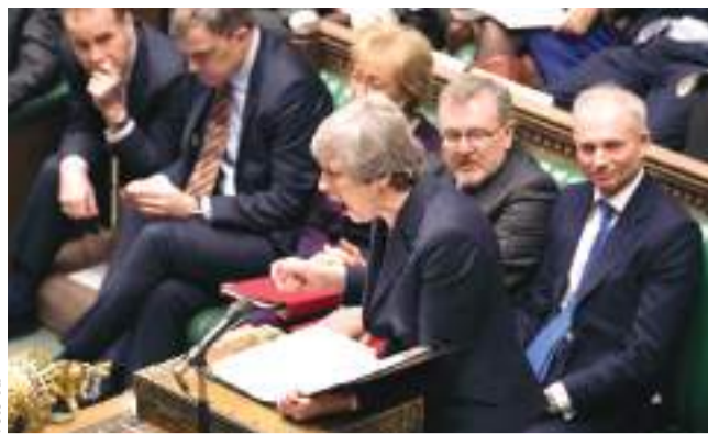
THERESA MAY, ayer, en el Parlamento.