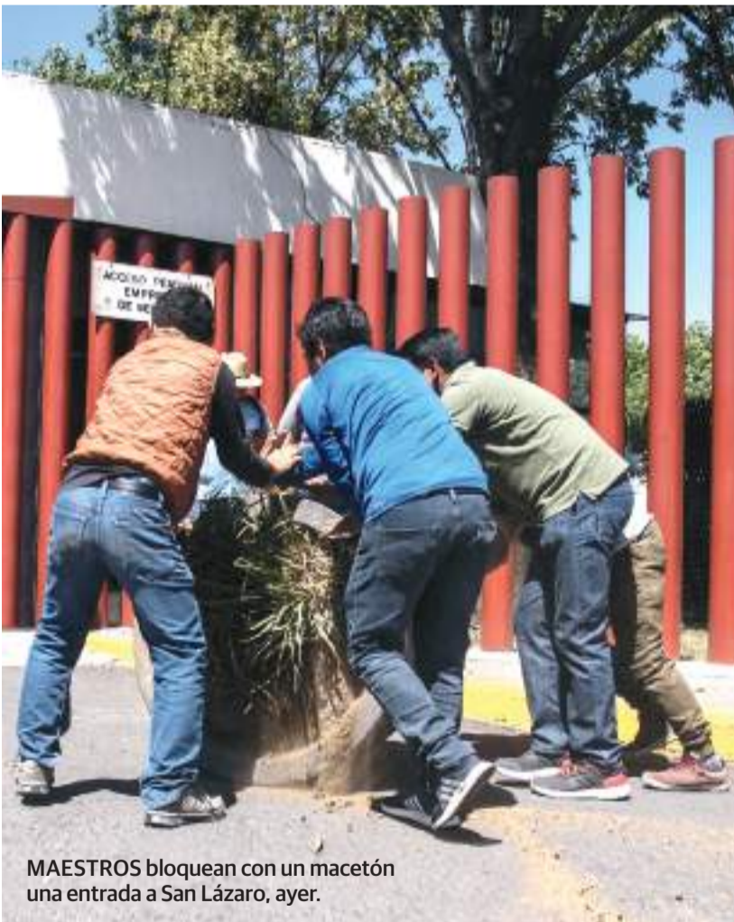
MAESTROS bloquean con un macetón una entrada a San Lázaro, ayer.

»Rechazan disidentes dictamen aprobado y cercan otra vez San Lázaro; chocan con trabajadores; van por bloqueo indefinido pág. 3