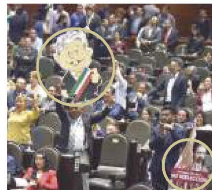
MORENISTAS enarbolaron la figura de AMLO y la oposición, la de Madero.