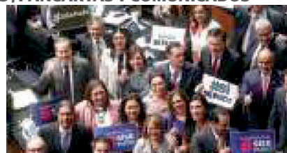
PANISTAS, priistas y perredistas, ayer.

ALFONSO DURAZO , secretario de Seguridad y Protección Ciudadana, aplaude acuerdo alcanzado; destaca que será un cuerpo de excelencia págs. 4 y 5