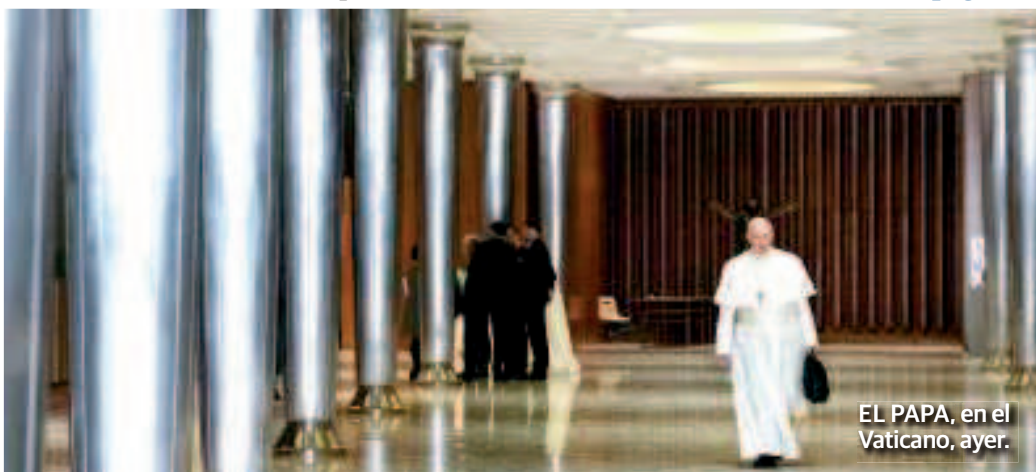
EL PAPA, en el Vaticano, ayer.

En cumbre con 190 líderes religiosos el Papa presenta 21 propuestas para evitar abusos sexuales a menores; Dios espera no sólo condenas, sino medidas concretas, dice. pág. 22