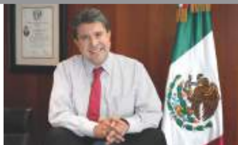
EL SENADOR Ricardo Monreal, ayer, en la entrevista con La Razón .

Ricardo Monreal Pdte. Junta de Coord. Política "Es una falacia que (en la Corte) digan que por intentar disminuir sus privilegios se esté afectando su autonomía"