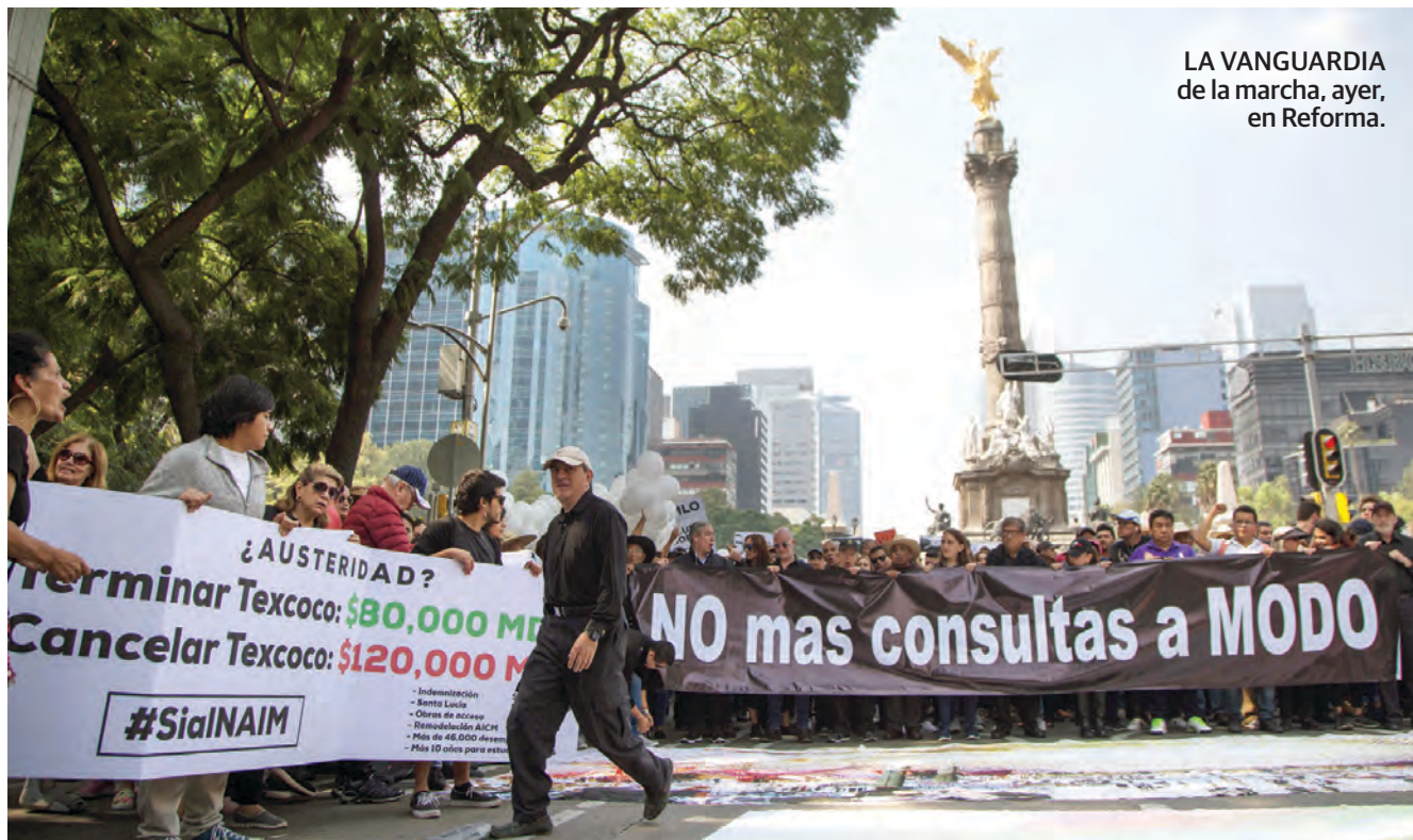
LA VANGUARDIA de la marcha, ayer, en Reforma.

Más de cinco mil protestan contra la cancelación del nuevo aeropuerto; también rechazan la presencia de Nicolás Maduro en la toma de posesión de AMLO; en redes, quienes se califican de "ffifis" y "chairo" atizan la polarización social. pág. 7