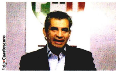
Enrique Ochoa Reza Presidente del PRI

Acusa que hay indicios de que fondos para transacciones inmobiliarias que realizó provienen de moches; le exige probar que con ingreso de $90 mil pudo comprar terreno de 10 mdp. pág. 4