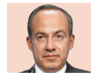
Felipe Calderón Hinojosa Ex-Presidente de México "Si gana fórmula Larios-Cortés) Será el fin del PAN"

»El nieto del fundador del PAN repudia postulación de dupla Marko Cortés-Héctor Larios; Ernesto Ruffo la impugnará hoy; Felipe Calderón avisa "fin del PAN" págs. 6 y 7