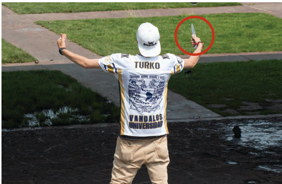
UNO DE LOS PORROS blande una navaja (círculo) en foto captada tras los ataques, el lunes.

En más de 300 tomas dio cuenta de cómo los porros atacaron con cuchillos, piedras, palos, petardos... a estudiantes que exigían seguridad en planteles; aquí, dos de sus imágenes.