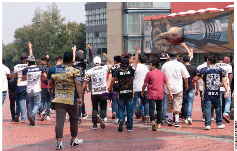
LOS AGRESORES, la mayoría con jersey, se repliegan tras la arremetida, el lunes.