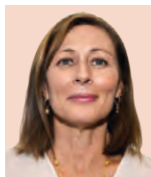
Tatiana Clouthier Diputada electa

»Vecinos de Polanco afirman que con Xóchitl Gálvez aumentaron establecimientos irregulares; documentan casos; alcalde electo ofrece cero tolerancia pág. 13